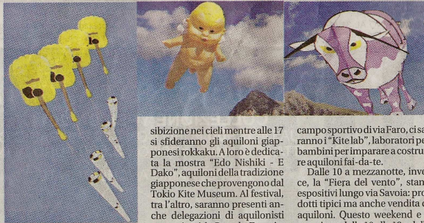
"All kites flight"

Il "festival degli aquiloni" si aprirà domani alle 11,30 sulla spiaggia con "All kites flight", tutti gli aquiloni che partecipano alla manifestazione in volo